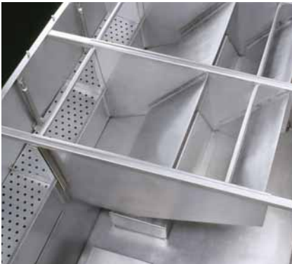
Canaux modulaires de conduction d'écoulement

La quantité des canaux de jet correspond à tout le débit demandé. Ceci fait les forces de jet pour demeurer constantes et mène par conséquent à une décarburation optimale.