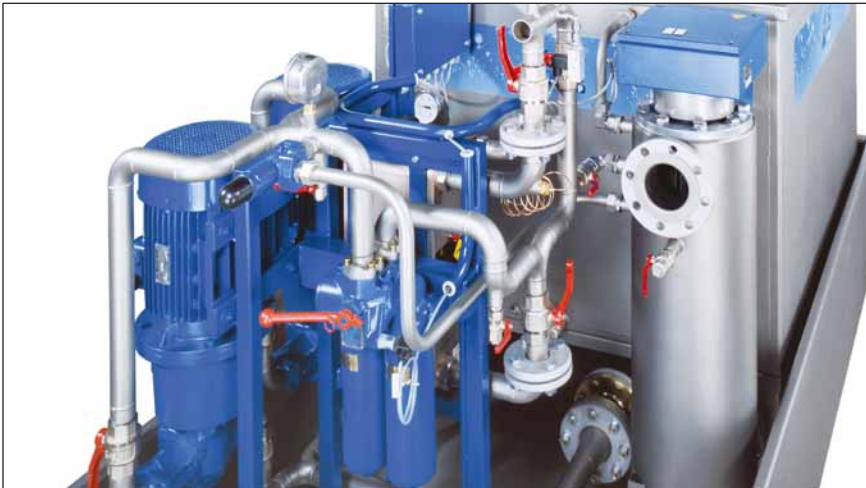
LubrifleX MIDI 1500 litres

LubrifleX est le système innové de lubrification d'huile de l'entreprise AS Antriebstechnik & Service GmbH. Il forme la composante essentielle dans l'approvisionnement en huile des commandes et garantit l'alimentation d'huile lubrifiante des systèmes complexes. Il veille également à la température de fonctionnement, la pureté et au dégazage optimal du lubrifiant dans le cycle. À proximité d'une température et de la pureté, le dégazage forme un élément essentiel pour la durée de vie de l'huile. Des conditions hydrodynamiques optimisées dans le système de LubrifleX sont la base pour un dégazage presque complet. L'oxygène aérien nuisible est divisé dans un processus à plusieurs niveaux et cela agit contre le vieillissement anticipé du lubrifiant industriel.