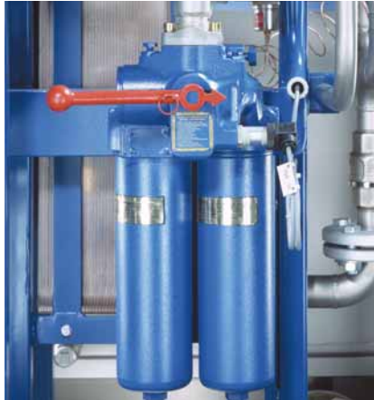
Contitions spécifiques assorties de filtrage d'huile

Selon le souhait des clients, Lubriflex est équipé de systèmes simples ou doubles de filtre avec le manomètre et la maille individuelle.