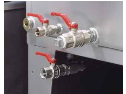
L'usine a mis en place des options de raccordement additionnelles

LubrifleX est préparé à plusieurs fonctions. Pendant la mise en activité, un filtre supplémentaire peut être joint et le raccord d'une installation de drainage est possible de façon alternative. En outre, un raccord est installé du côté de l'usine pour avertir la venue de l'eau.